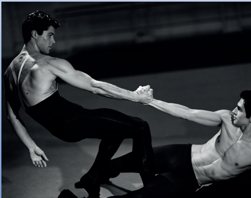
Roberto Bolle and Federico Bonelli, Royal Opera House, London, England 2008.