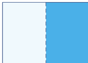
3. strana obálky 148 × 210 mm (+ spad 4 mm) 23 000 Kč